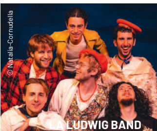
LA LUDWIG BAND

Després de La Nit del Tararot, hi ha previst un triple concert amb La Ludwig Band, Sexenni i Ketekalles. La Ludwig Band arriben a la capital de l'Urgell per presentar el seu tercer treball discogràfic, Gràcies per venir (The Indian Runners / Ceràmiques Guzmán, 2023), Premi Enderrock 2024 a millor disc de pop-rock. Els lleidatans Sexenni estrenaran a la plaça de les Nacions sense Estat la seva darrera col·laboració amb The Tyes, "Grup de pop", una nova cançó que complementar el seu darrer treball Supernova (Delirics, 2023) i tancarà la nit el grup barceloní Ketekalles , banda que reivindica el paper de la dona als escenaris a través de la música amb la fusió de diversos gèneres, com el soul i el hip-hop.