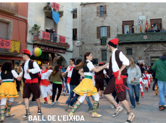
BALL DE L'EIXIDA

La Festa Major atorga protagonisme als diversos elements del folklore tradicional local. Després del solemne ofici en honor a les Santes Espines, el primer ball de la vetllada serà el Ball dels Valencians i tot seguit el Ball de l'Àliga de Tàrraga. Després, autoritats i ciutadania ballaran l'Eixida, la dansa típica de Tàrraga. Després, Nans, Gegants, Arquets, Cavallets, Bastonets, Verreta, Gitanes i Tossino. Himne de la Verge de l'Alba. Balls de Bastonets amb l'Esbart Albada; Ball de Gegants amb La Fal·lera Gegantera; Ball de les Gitanes de La Soll; Balls d'Arquets, Nans, Cavallets, La Verreta i Lo Tossino amb Guixanet. La música en directe anirà a càrrec de la Coblà Tàrraga, els Grallers del Tararot i La Follia.