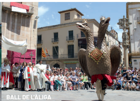
BALL DE L'ÀLIGA